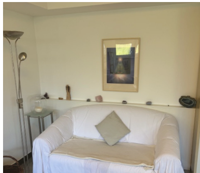
Bequemes Sofa – Ein Platz für eine Pause oder ein stilles Gespräch