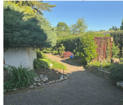
Blick in den ruhigen Garten