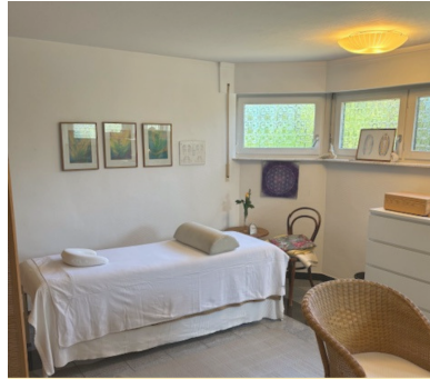
Ruhevolle Atmosphäre: Der Platz für Behandlung & Entspannung.