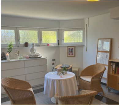
Vertrauliche Gespräche in der gemütlichen Anamnese- und Beratungsecke.