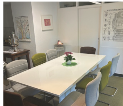
Freundlich und einladend: Der Wartebereich