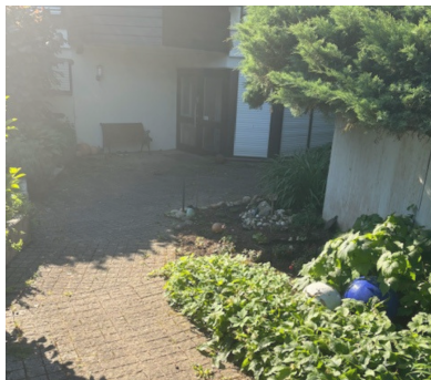
Grüner, geschützter Eingangsbereich