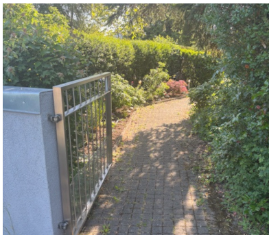
Willkommen: Zugang durch den Gartenweg