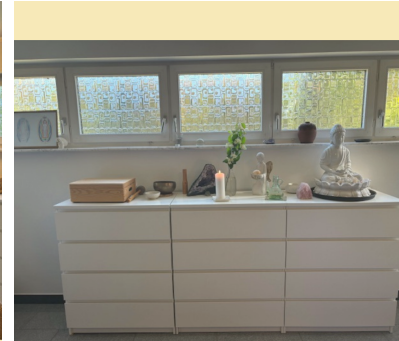
Platz für Materialien und kleine Rituale.